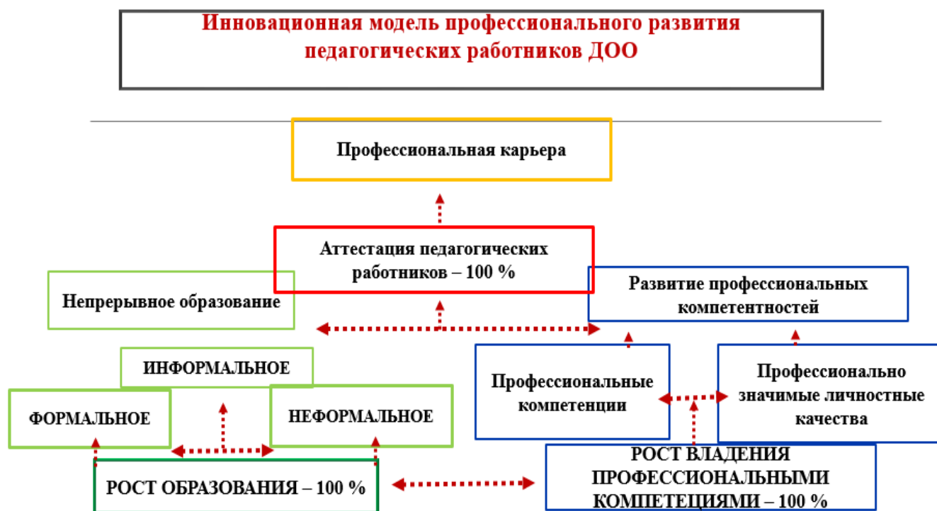
Рисунок 1. Инновационная модель профессионального развития педагогических работников ДОО.

дефектологов, педагогов-психологов в соответствии с реализуемой в условиях МАДОУ детского сада комбинированного вида №8 «Гармония» инновационной модели профессионального развития педагогических работников ДОО (см. рис. 1.).